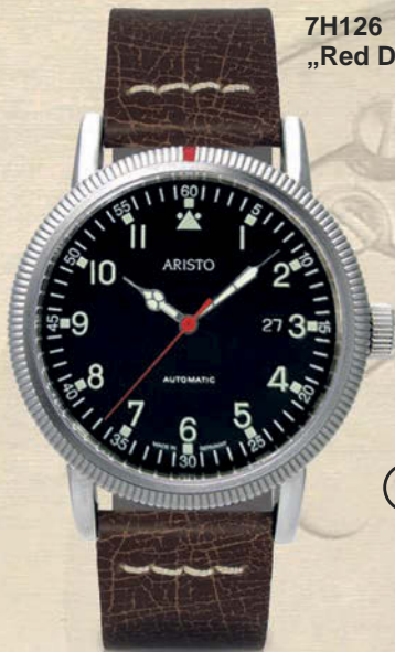
7H126 „Red Dot“