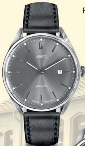
Titan- Sonnenschliff 4H213-S