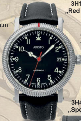
3H197 „Red Dot“