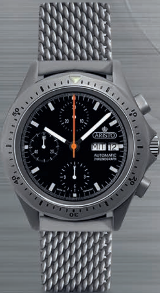
3H242-M € 1.395,--

Sellita SW 500 Caliber 13 1/4, 25 Steine Incabloc Stoßsicherung 28.800 A/h, Sekunden-Stopp