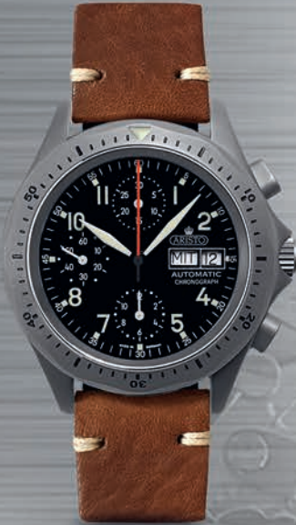
3H243-VL € 1.330,--

Modell 20050 mit Leuchtziffern und -Zeiger Kalender Day-Date wasserdicht 5 atm Sellita SW 500 Saphirglas Ø 40,5 mm Höhe 14 mm