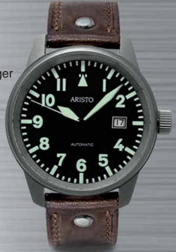
5H101Ti € 595,--