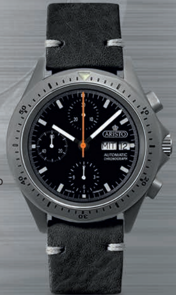
3H242-L € 1.330,--