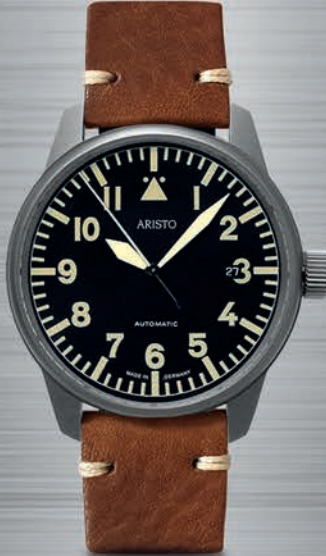
5H101Ti-VIN € 625,--

integriertes Titanband mit Faltverschluss