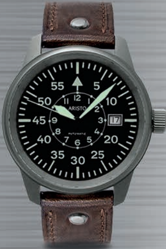
5H102Ti € 595,--