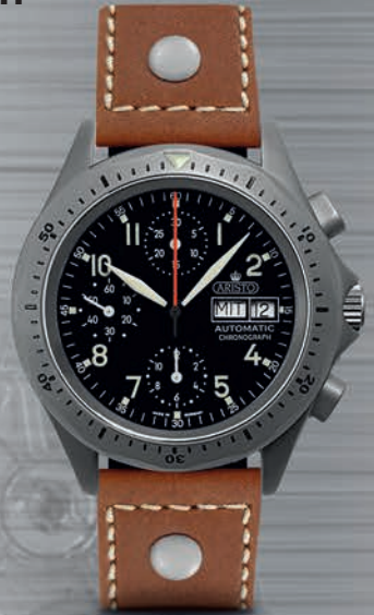
3H244-FL € 1.390,--

Modell 20050 mit Leuchtziffern und -Zeiger Kalender Day-Date wasserdicht 5 atm Sellita SW 500 Saphirglas Ø 40,5 mm Höhe 14 mm