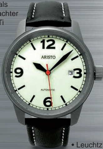
5H69Ti € 595,--