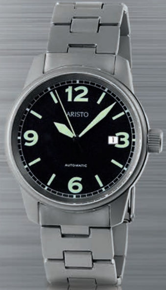
5H67TiBi € 650,--