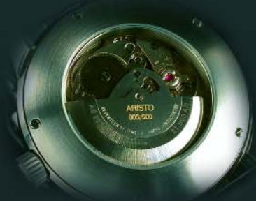
Schwarze AS Ref. 7H16* Modell: Flieger Ø 40 mm €650,--

Aus hochwertigen Materialien und mit feinsten Uhrmachertechnik fertigt ARISTO Kunstwerke von einzigartig zeitloser Schönheit.