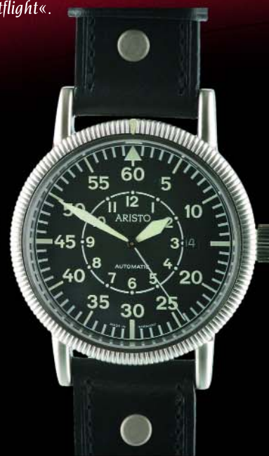
Dayflight Ref. 3H43 Edelstahl, 5 atm, Saphirglas, Drehlünette Automatic, ETA 2824-2 Ø 44 mm € 495,--