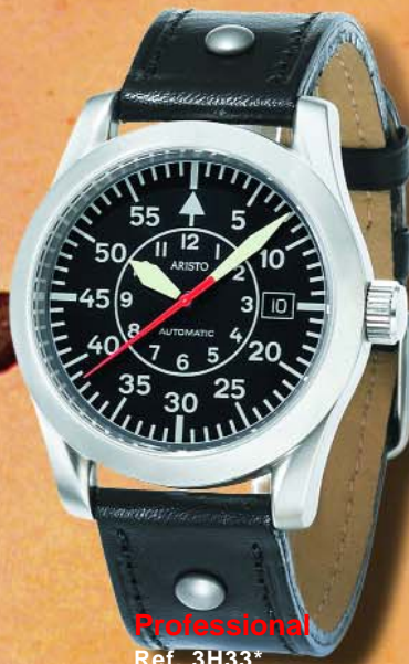
Professional Ref. 3H33* Edelstahl, 5 atm, Saphirglas, Automatic, ETA 2824-2 Ø 40 mm € 378,--

Elegant und rasant. Rasse trifft Klasse. Flieger-Profis loben die technischen Qualitäten, Uhren-Sammler die Optik, dieser zwei Präzisionsinstrumente.