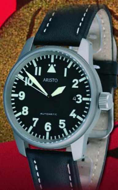
Titan Flieger Ref. 5H67TI* Titan, 5 atm, Mineralglas Automatic, ETA 2824-2 Ø 41 mm € 313,--