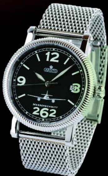
Kleine Tango Tango Ref. 4H262-TT* Edelstahl, 5 atm, Saphirglas, Milanaisband, Automatic, ETA 2824-2 Ø 38 mm € 478,--