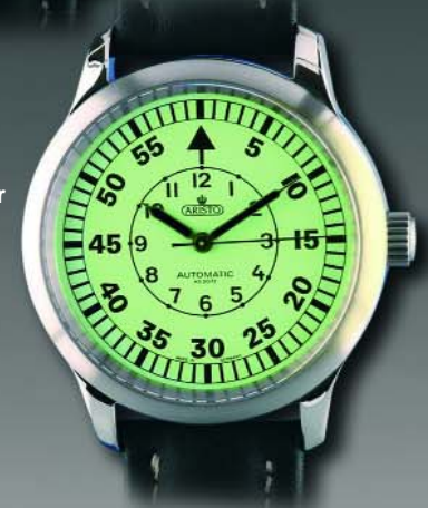
Gelbe AS Ref. 7H37* Modell: Offizier Ø 40 mm €650,--

* Diese Uhren-Modelle besitzen einen Glasboden