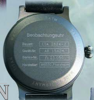
Beobachter Ref. 5H37S €313,--