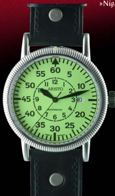
Nightflight Ref. 3H42 Edelstahl, 5 atm, Saphirglas, Drehlünette Automatic, ETA 2824-2 Ø 44 mm € 495,--