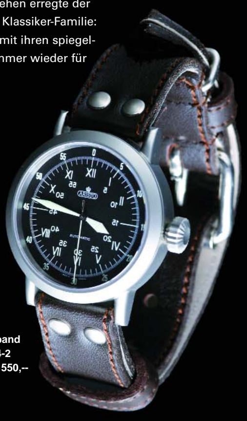
XL Sextant Ref. 3H78 * Edelstahl, 5 atm, Saphirglas, Riemenband Automatic, ETA 2824-2 Ø 43 mm €550,--

Noch größeres Aufsehen erregte der vierte Spross dieser Klassiker-Familie: die „Sextant“ sorgt mit ihren spiegelverkehrten Ziffern immer wieder für Gesprächsstoff.