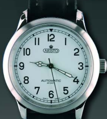
Weisse AS Ref. 7H28* Modell: Marine Ø 40 mm €650,--