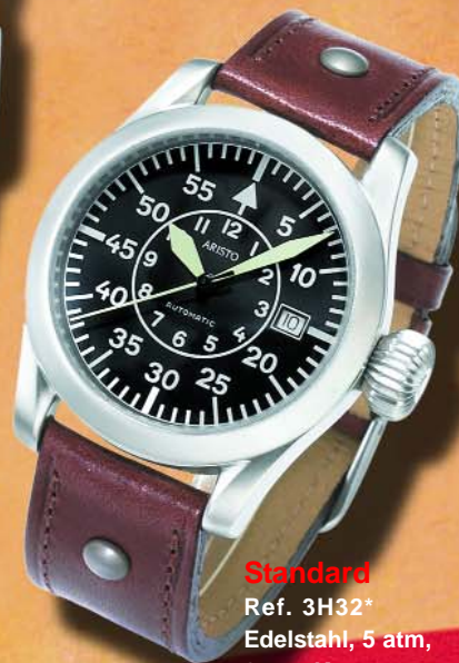
Standard Ref. 3H32* Edelstahl, 5 atm, 8 mm Krone, Automatic, ETA 2824-2 Ø 40 mm € 330,--